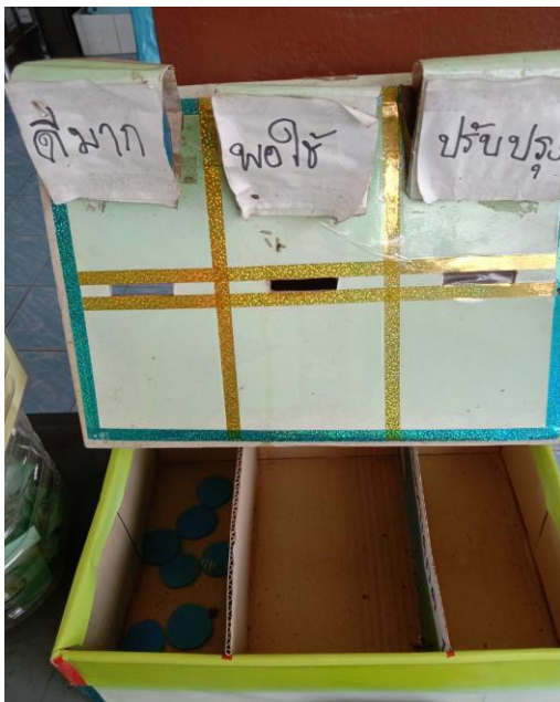
สถานีอนามัยคลองตาสุตร