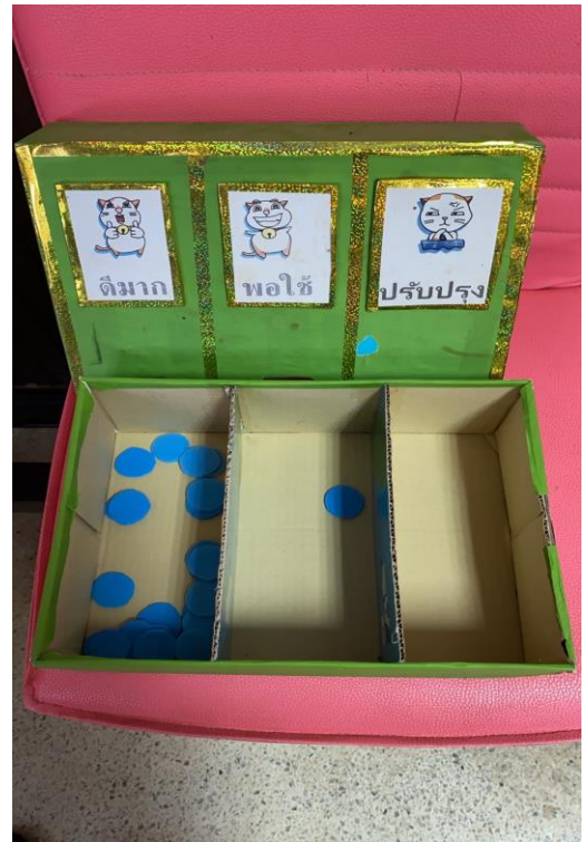
กองสวัสดิการสังคม