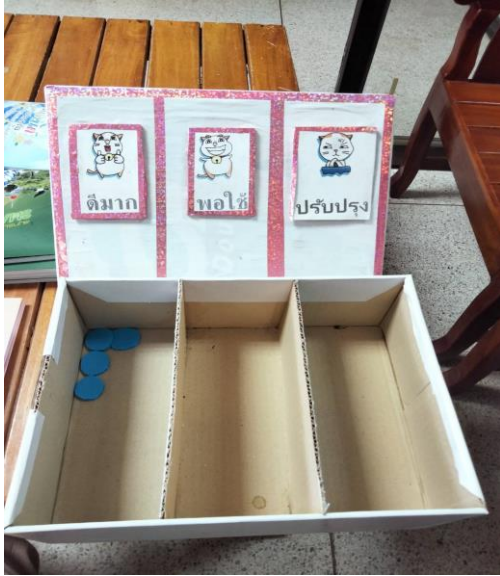
สำนักปลัด