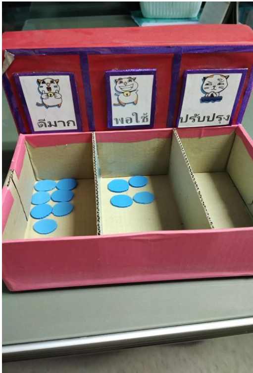
กองการศึกษาฯ