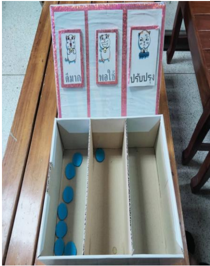
สำนักปลัด