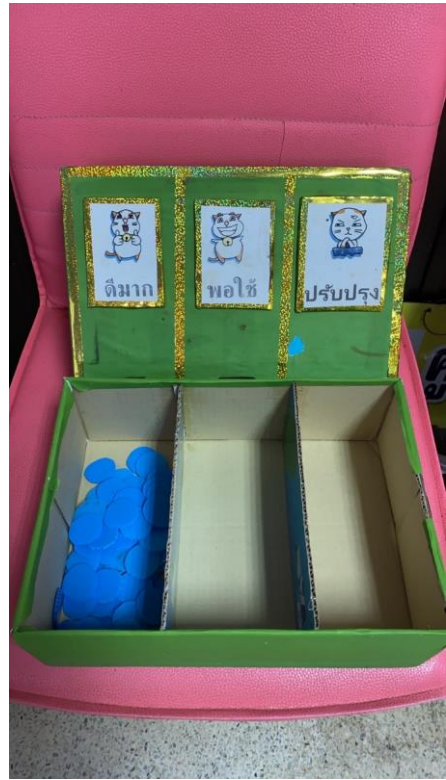
กองสวัสดิการสังคม