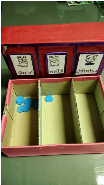
กองการศึกษาฯ