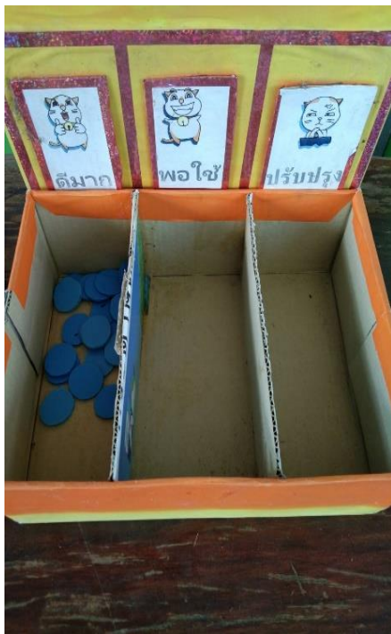
สถานีอนามัยคลองหินปูน